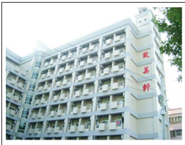
致美軒 Kí túc xá nữ