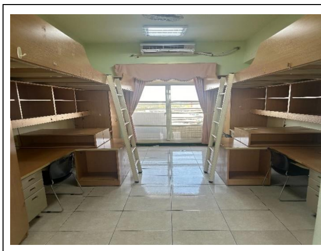
房間設備 Thiết bị trong phòng