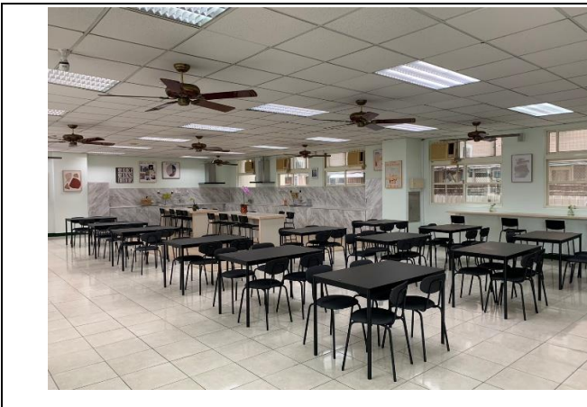
交誼廳 Phòng sinh hoạt chung