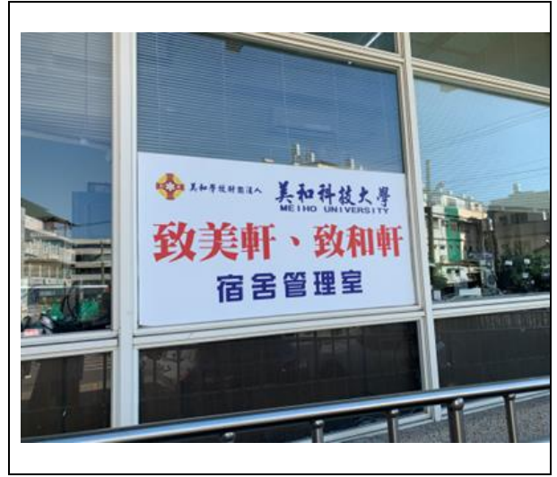
致和軒 Ký túc xá dành cho sinh viên nam