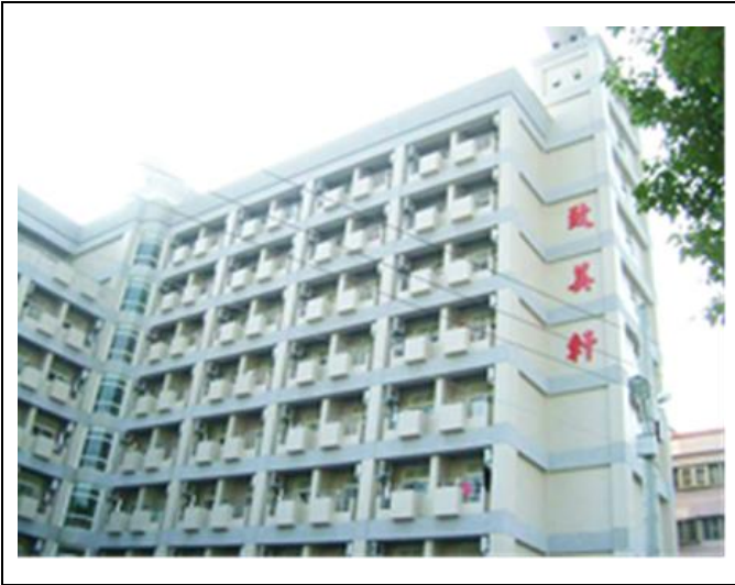
致美軒 Ký túc xá cho sinh viên nữ